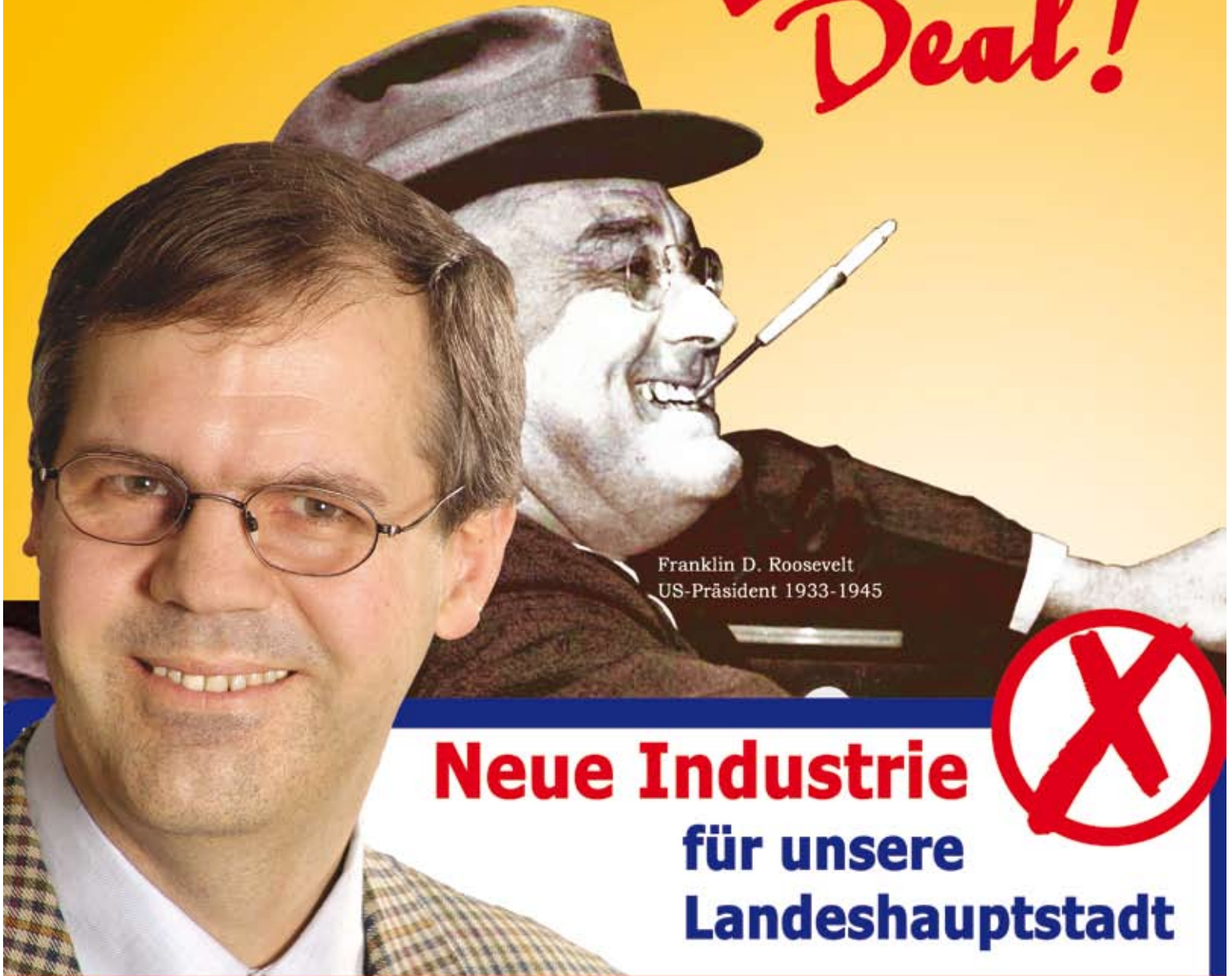
Franklin D. Roosevelt US-Präsident 1933-1945

Neue Industrie für unsere Landeshauptstadt