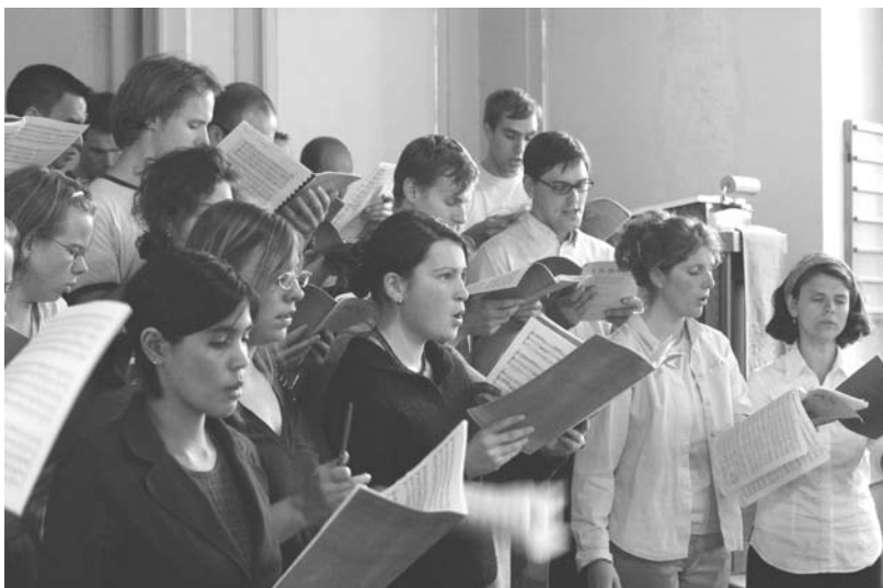
Mit klassischer Musik gilt es, eine Renaissance in Europa zu schaffen

Das ist besonders so, seit zwischen 1945 und Anfang der 50er Jahre die „68er Generation“ erfunden wurde.