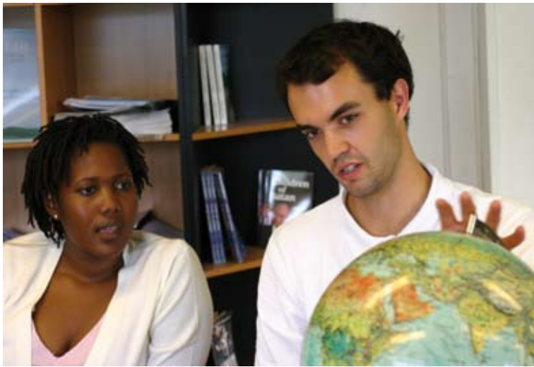
Mitglieder der LaRouche-Jugendbewegung bei der Arbeit an sphärischer Geometrie...