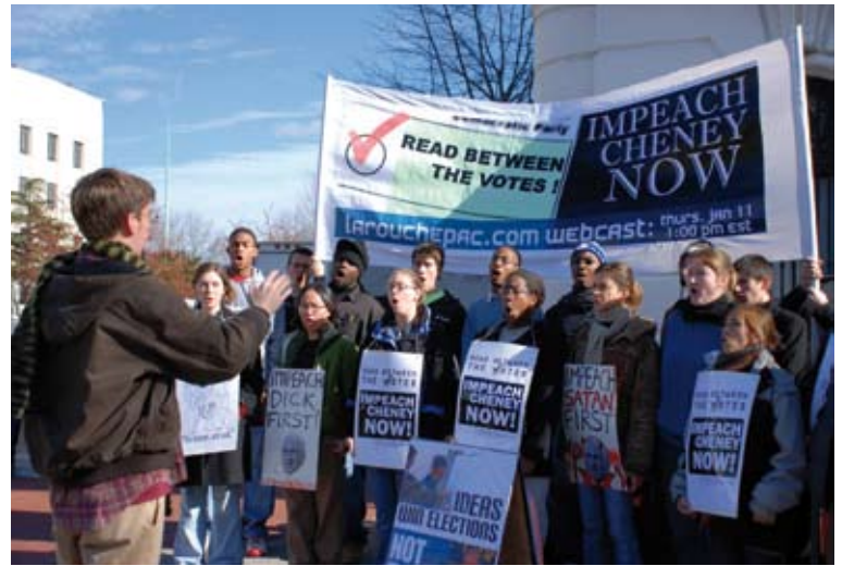
... und beim politischen Organisieren mit Gesang und Polemik, und der Forderung nach Vizepräsident Cheneys sofortiger Amtsenthebung.

Nachdem durch unseren entscheidenden Einsatz der Wahlsieg für die Demokraten absehbar war, kam auch Bill Clinton nach Texas. Er ist ein Verbündeter von mir bei den Demokraten, ebenso wie der Wahlkampfespezialist James Carville. Clinton unterstützte unsere Bemühungen in diesem Wahlkreis, und es gelang ihm, die ganze Gegend zu mobilisieren. So gelang ein wahrer Erdrutschsieg über einen langjährigen republikanischen Amtsinhaber.