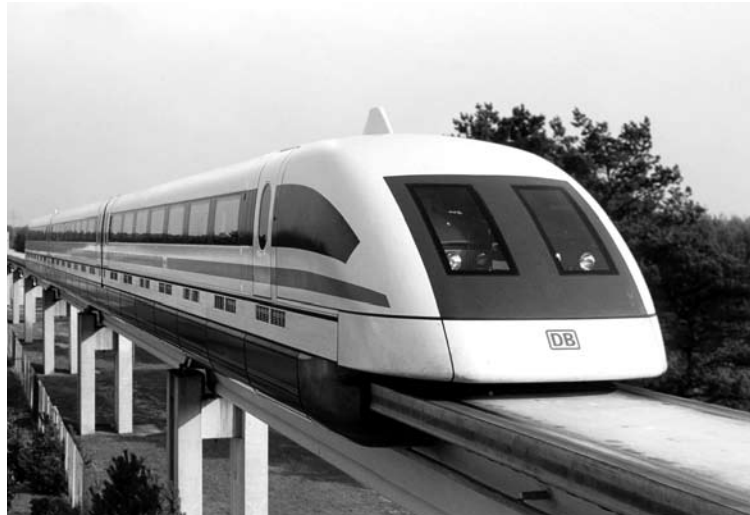
Die BüSo will die bestehenden Verkehrssysteme durch den Bau eines gesamteuropäischen, umfassenden Magnetbahnnetzes ergänzen.

Ähnlich ist es bei der Bahngesellschaft Vectus, an der das Land Hessen und mehrere Landkreise beteiligt sind und die inzwischen die Ländchesbahn betreibt. Selbst wenn uns bei der WIBUS ein ähnliches Debakel wie in Hanau erspart bleiben sollte, ist eine solche „Lösung“ auf dem Rücken der Busfahrer und des Bahnpersonals moralisch nicht vertretbar. Sie ist ein Beispiel für den „Asozialismus“ Marke Koch & Müller, den es zu überwinden gilt.