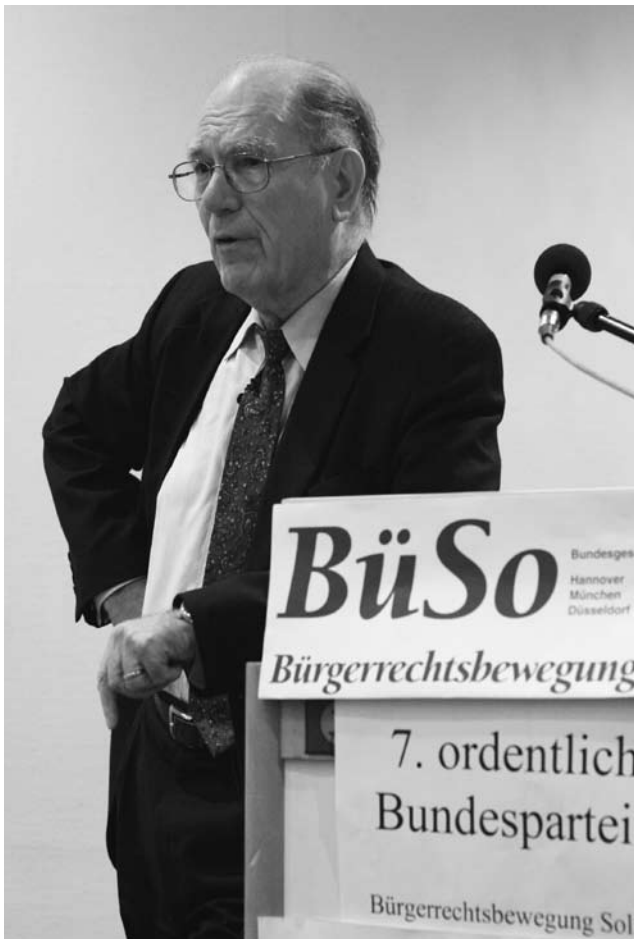
Lyndon LaRouche, während seiner Rede auf dem Bundesparteitag der BüSo in Frankfurt im Dezember 2006.

einem Massensterben auf diesem Planeten führen könnte! Die Weltbevölkerung könnte von sechs Milliarden auf unter eine Milliarde absinken. Diese Möglichkeit besteht durchaus, wenn weltweit wirtschaftliches Chaos ausbricht! Ohne weltweite Kooperation gibt es keinen Weg, um zu verhindern, daß die Depression in ein finsternes Zeitalter einmündet. Wir sind höchstens Monate von diesem Zeitpunkt entfernt, und man muß eine Entscheidung treffen.