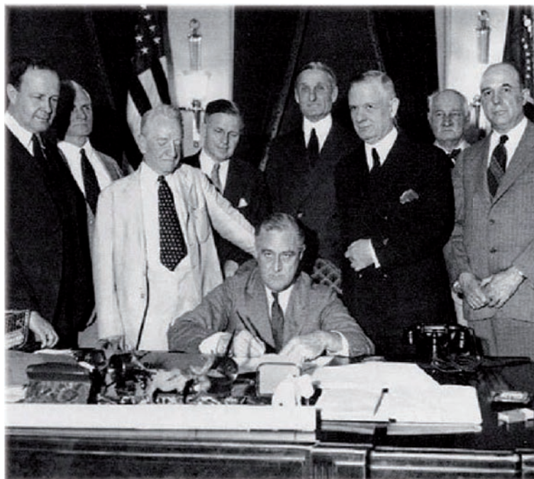
Franklin D. Roosevelt unterschrieb hier das Glass-Steagall-Gesetz 1933, welches dafür sorgte, daß die Geschäftsbanken von den Investmentbanken getrennt werden und damit die Spekulation mit einfachen Bankeinlagen verhinderte.

Genau diese Mischung aber ist es, was EU-Kommission und EZB jetzt propagieren. Absurderweise sind da selbst gewisse Kräfte im IWF progressiver, die feststellen, daß alle Rezepte des IWF in den neunziger Jahren und seitdem nicht funktioniert haben. Als man z.B. Argentinien zwang, zu sparen, abzuwerten und zu privatisieren, wurden lediglich nationale Vermögenswerte verschertelt, und das Land blutete aus. Genau das ist jetzt die Medizin, die Griechenland schlucken soll. Woher soll es dann die Kraft nehmen, die Schulden zurückzubezahlen? Dazu bräuchte man ein Tischlein-deck-dich!